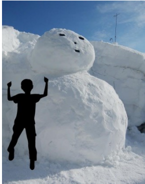
平成30年作成の巨大雪だるま

今年の冬は全国的に暖冬・小雪の傾向にあるようです。 豪雪地の新潟県十日町市でも、経験したことが無いような暖かい冬です。12月の平均気温は平年を0.6度上回る3.2度でした。 近年では、平成21年や平成28年が小雪ではありましたが、雪景色が広がっていません。長い冬に合わせた地域の暮らしがあるので、普段あるものがないのは良し悪しです。 とはいえ、やはりここは雪国、まだまだ春は先です。また、標高の高いスキー場では十分にウィンドスポーツを楽しむことができます。 どうぞ、雪国新潟へお越し下さい。